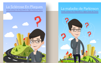
Nos guides ressources

*Equipe Spécialisée de Prévention et de Réadaptation A Domicile