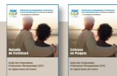
Nos guides ETP