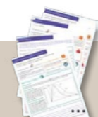
Fiches traitements maladie de Parkinson