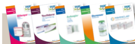
Guides traitements Sclérose en Plaques